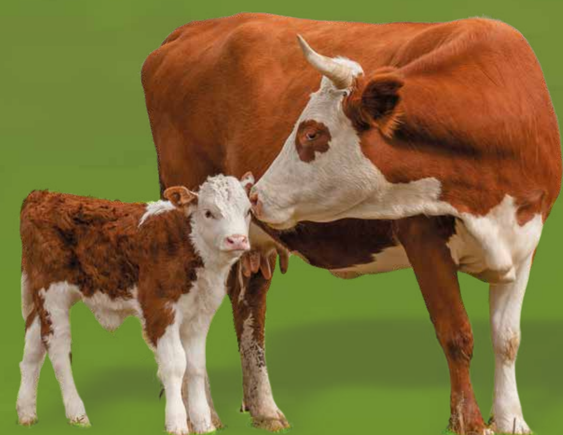
Braune und braun-weiß gefleckte „2-Nutzen-Rinder“ dienen der Milch- und Fleischproduktion.

Liter pro Jahr 7.600 l Milch gibt eine Kuh im Durchschnitt